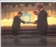
창립 회원님께 기념품 증정!!