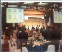
작고 회원들을 위한 목념 !!