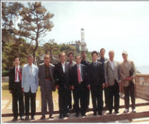
동백섬 누리마루 관광 뒤..