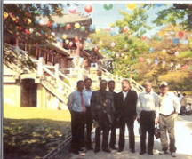
경주 불국사, 석굴암, 박물관 관광!