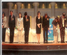
신입회원 부부 인사 중에..