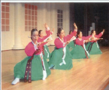
거제 무용단의 산조 공연중..