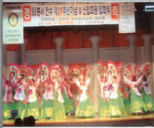
공연 하이라이트 ~ 부채춤 !!!