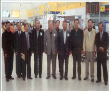
내년에 뵈겠습니다 !!