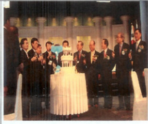
제2부 축배 및 케익 커팅!!