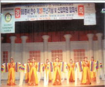
화사하고 고운 화관무 공연중.