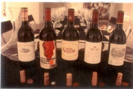
▲ 5대 샤토 와인 사진

한국 사람들이 프랑스 와인 특히 보르도 와인을 이야기 할때 꼭 등장하는 것이 '샤또' (chateau) 이다. 샤토의 사전적인 의미는 '성곽' 또는 '대저택'을 뜻하는데, 와인과 관련해서는 포도원이나 자체 내 포도 농장을 가진 와인 공장 이란 뜻으로 와인 고유 명사나 브랜드가 아닌 포도를 생산 하는 곳을 말한다. 법률에 의하면 일정 면적 이상의 포도원이 있는 곳으로 와인을 제조하고 저장 할수 있는 시설을 갖춘 곳이라야 샤토라 칭 할수 있다.