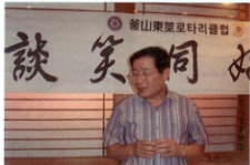
▲08-09년도 서원담소회 회장님~

참 석: 다공, 동제, 벽산, 소제, 서원, 동헌, 소정, 경암, 승천, 벽하, 학정, 화담, 영호영, 김영길, 자은