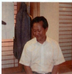
▲경암 담소회 총무님~