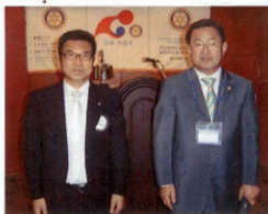
▲ 더운날씨에 본 클럽을 위해 와주신 제 3지역구 총재지역대표님~