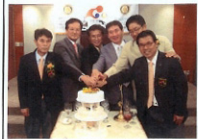
▲생신을 진심으로 축하드립니다!