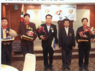
▲신임회원님께 드리는 선물 증정!!