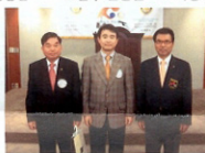
▲신임회원 추천해주신 화산전회장님, ▲신임회원 선~서!! 자경회원님, 무선회장님 영성이 봉사하였습니다.