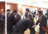
▲신임회원님, 회원간의 상례!!