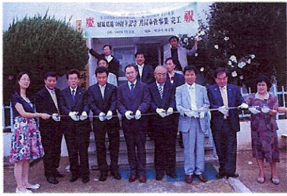
▲2009년 7월 29일 부산일보 25면에 등재됨