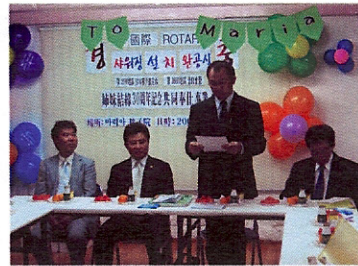
▲사에키 회장님 인사말씀!!