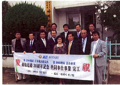
▲마리아 모자원 행사를 마치고 !!