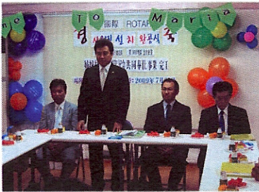
▲백산회장님 인사말씀 !!