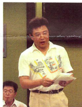
▲유머있는 사찰활동 해주신 벽산사찰위원장님~