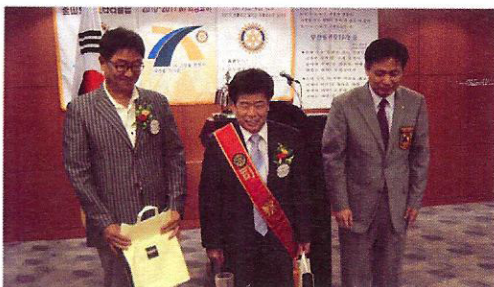
▲특별히 비싼(?)생일선물을 드렸습니다.