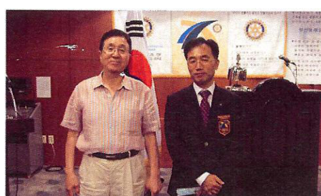
▲7-8월 개참선물을 대표로 받으신 화담총무님!!