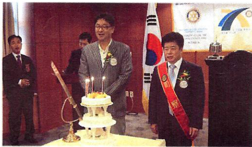
▲해강회원님, 수광회원님 생신 축하드립니다^^