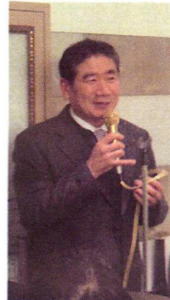
▲더 열심히 봉사하겠다고 하시는 고암 회원님!!