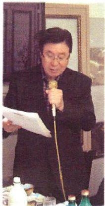
▲동제 출석위원장님~ ▲즐거운 친목주회시간~