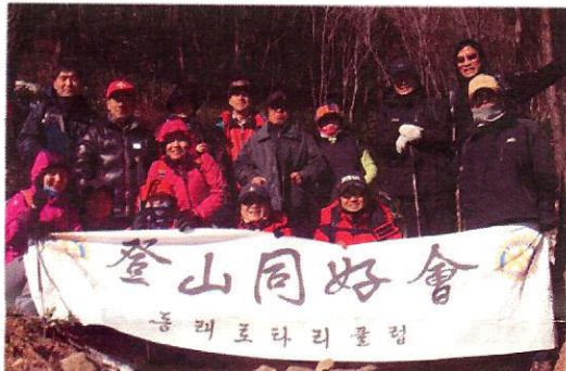
▲영하의 날씨도 등산동호회를 막을 순 없죠~