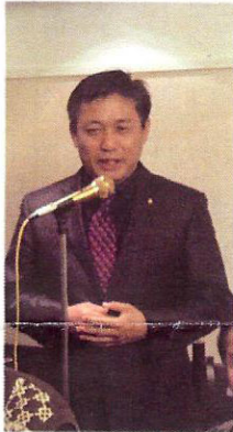
▲송남회장님 인사~ ▲자리를 가득메워주신 회원 여러분!!