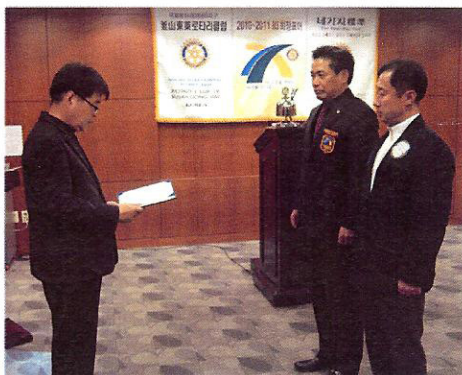
▲봉사의인 증서 전달 중~