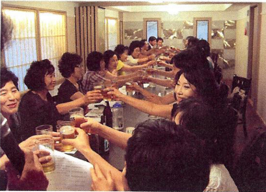
11-12년 활기찬 출발을 위해 건배!!