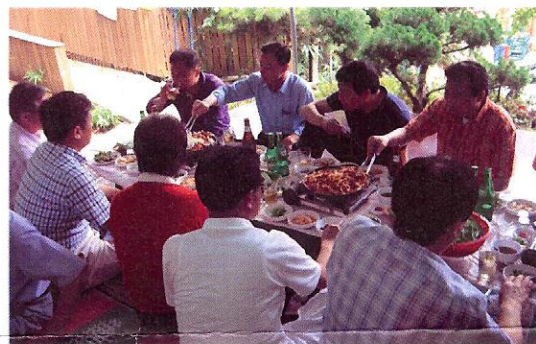
오리고기와 낫술 한잔~~