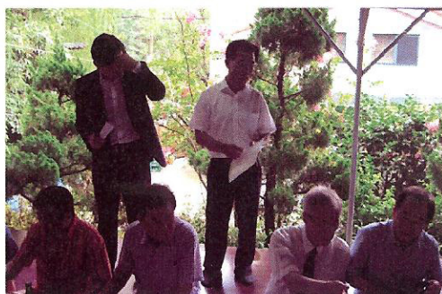
총무역할을 대신 해 주신 화담 재무님~