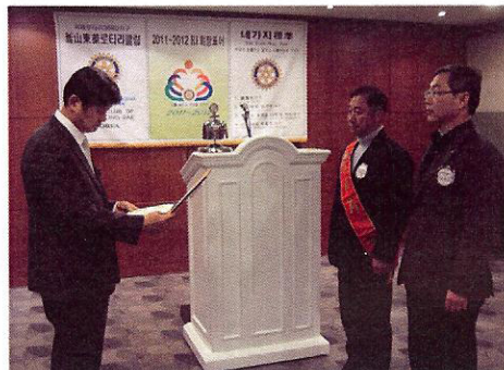
P.H.F 증서 전달중~ (청해회원님, 청강회원님!!)